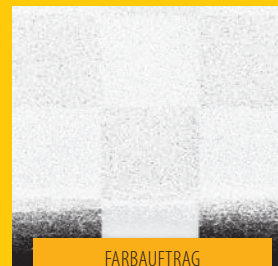
FARBAUFTRAG MIT ROLLE