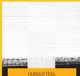
FARBAUFTRAG MIT PINSEL