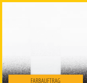
FARBAUFTRAG MIT WAGNER-SPRÜHGERÄT

WAGNER. Die schnelle, saubere und einfache Art Wandfarbe aufzutragen.