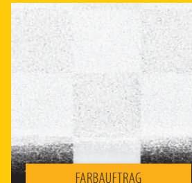
FARBAUFTRAG MIT ROLLE