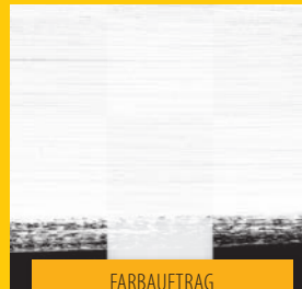
FARBAUFTRAG MIT PINSEL