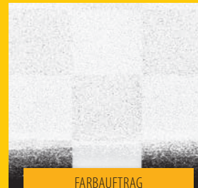
FARBAUFTRAG MIT ROLLE