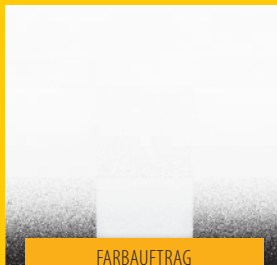
FARBAUFTRAG MIT WAGNER-SPRÜHGERÄT

WAGNER. Die schnelle, saubere und einfache Art Farbe aufzutragen.