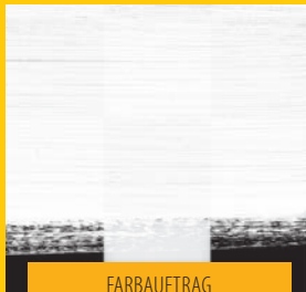
FARBAUFTRAG MIT PINSEL