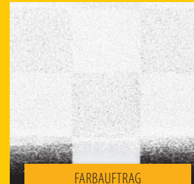
FARBAUFTRAG MIT ROLLE