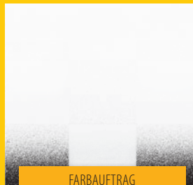
FARBAUFTRAG MIT WAGNER-SPRÜHGERÄT

WAGNER. Die schnelle, saubere und einfache Art Farbe aufzutragen.