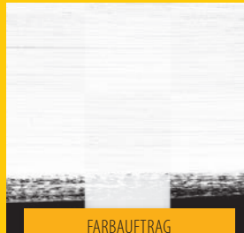
FARBAUFTRAG MIT PINSEL