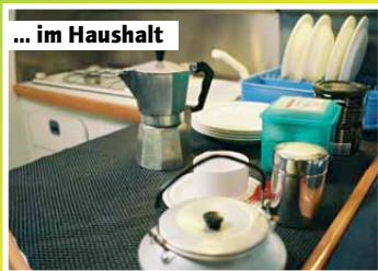
... im Haushalt