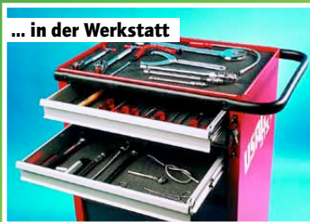
... in der Werkstatt