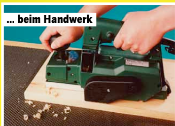
... beim Handwerk