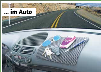
... im Auto