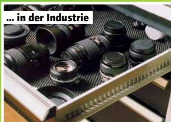
... in der Industrie